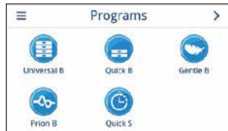
디스플레이에서 프로그램 선택